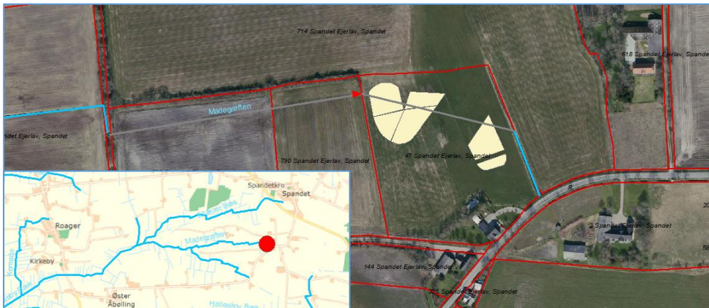
Fig. 1. Placeringen af minivådområdet på det rørlagte vandløb Madegrøften.

Minivådområdet ønskes etableret på en rørlagt strækning af det offentlige vandløb Madegrøften.