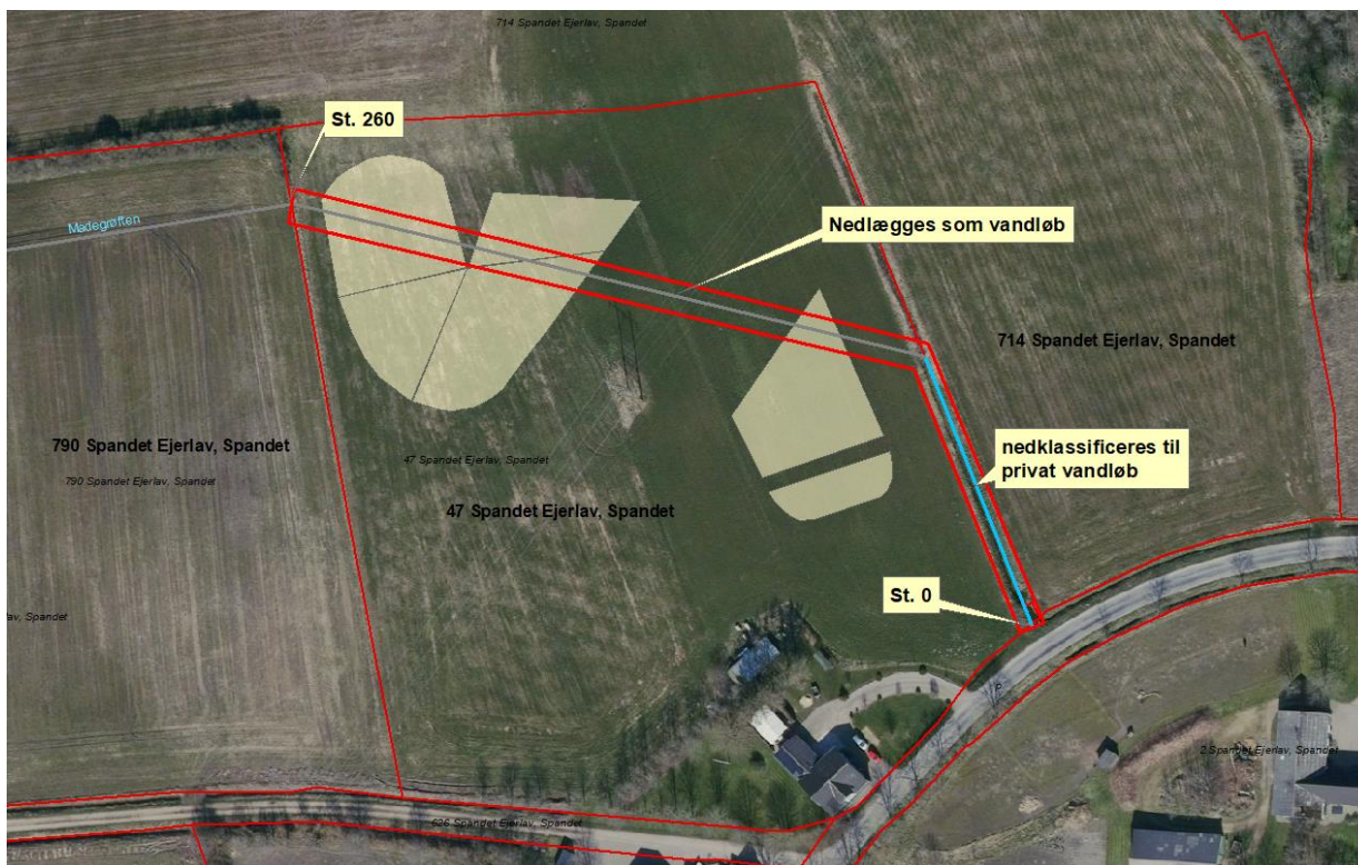
Fig. 4. Den rørlagte del af vandløbet nedlægges som vandløb. Den åbne del nedklassificeres til privat vandløb.

Nedlæggelse af den rørlagte strækning som vandløb sker først, når minivådområdet etableres.